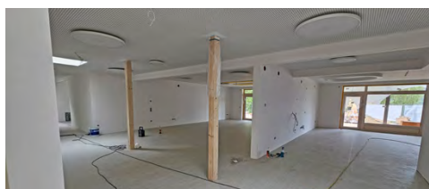
Kita Turmbergzwerge im Zeitplan