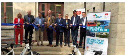
Mobilitätszentrale im Bahnhof Lauda