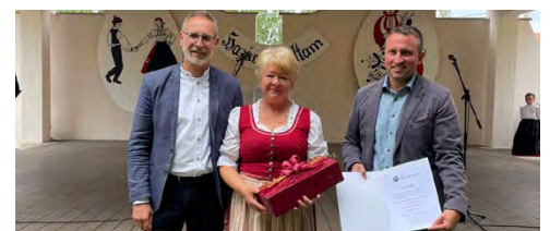
Städtepartnerschaft mit Rátka