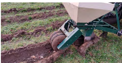
Blumen: Zwiebeln gelegt

SCHWERPUNKTTHEMA: RÜCKBLICK AUF EIN ERFOLGREICHES JAHR 2023