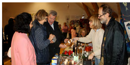
Frankreich: Besuch an Nikolaus