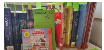
Stadtbücherei: Grusel in der Schule